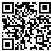
資料の取寄せ方法